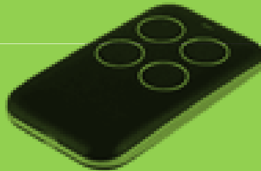
EJEMPLO CONTROL CLONADOR

SELECTOR DE LLAVE, CONTROLES CLONADORES MUTIFRECUENCIAS, BOTONERAS INALAMBRICAS, CENTRALES DE MANDO, FOTOCELDAS, ENTRE OTROS. REFRACCIONES PARA MOTORES SECCIONALES.